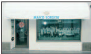
Sede MAICO Tolmezzo - Via Matteotti, 19/a