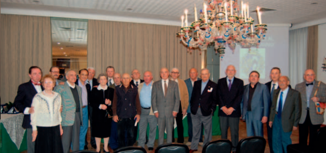
Gli "anziani della guida"