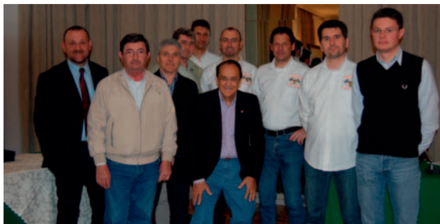
Gli sportivi premiati